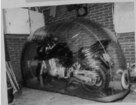
Van eind november tot medio maart zit de 'Bandiet' opgesloten in de Bike Bubble.

Vooraf had Joost al gezegd dat zijn motor er voor zijn leeftijd nog goed uitzag. Dat bleek niet overdreven toen hij bij MOTO73-expert Van Sleuwen Motoren in